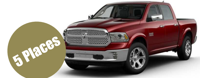
Version Crew CAB + RAM Box

5,7L HEMI V8 395CH Boite automatique 8 rapports