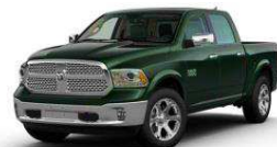
Black Forest Green