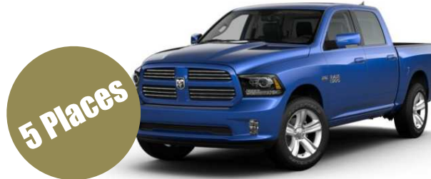
Version Crew CAB + RAM Box

5,7L HEMI V8 395CH Boite automatique 8 rapports