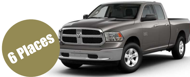
Version Quad CAB

5,7L HEMI V8 395CH Boite automatique 8 rapports